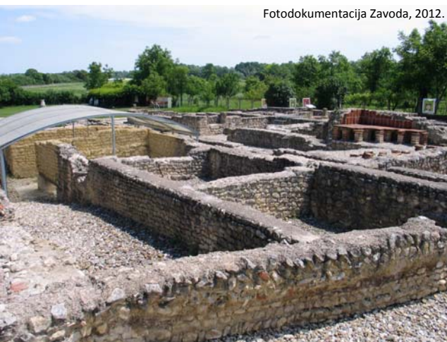
Fotodokumentacija Zavoda, 2012.