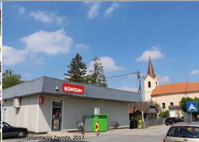
Fotodokumentacija Zavoda, 2017.