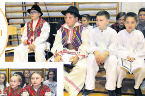
Matičnu školu u Donjoj Bistri u nastavnoj 2016./2017. polazi 453 učenika raspoređenih u 21 razredno odjeljenje. Još 138 učenika polazi područne škole u Jablanovcu i Gornjoj Bistri.

OŠ BISTRA TRENUTNO JE JEDINA ŠKOLA U ŽUPANIJI U KOJOJ SE NASTAVA ODVIJA U TRI SMJENE