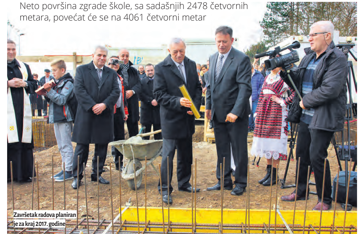
Završetak radova planiran je za kraj 2017. godine

Neto površina zgrade škole, sa sadašnjih 2478 četvornih metara, povećat će se na 4061 četvorni metar