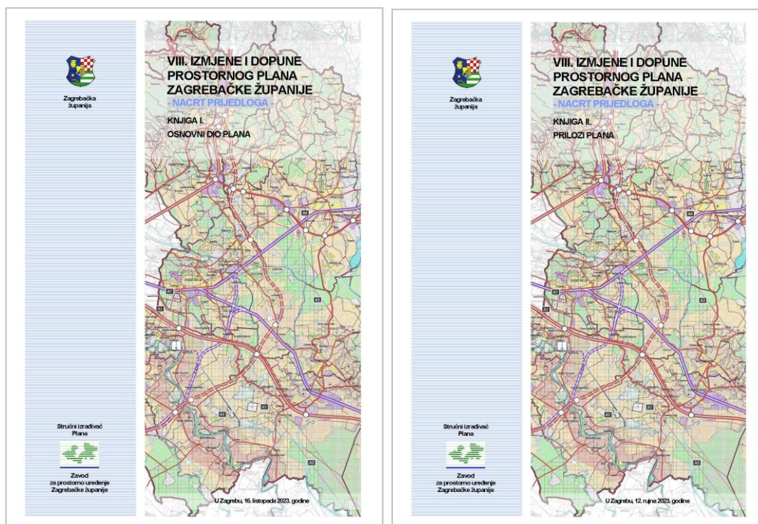
Slika 1: Nacrt VIII. Izmjena i dopuna Prostornog plana Zagrebačke županije- Knjige I. i II., (Zavod, listopad 2023.).

U ožujku 2023. godine Županijska skupština Zagrebačke županije donijela je Odluku o izradi VIII. Izmjena i dopuna Prostornog plana Zagrebačke županije („Glasnik Zagrebačke županije“, broj 11/23). Zavod je tijekom 2023. godine proveo analizu svih pristiglih zahtjeva javnopravnih tijela te fizičkih i pravnih osoba za izradom izmjena i dopuna ovog Plana, izradio Nacrt prijedloga prostornog plana koji je dostavljan stručnom izrađivaču Strateške studije utjecaja na okoliš za potrebe izrade navedene studije te održao desetak stručnih sastanaka s javnopravnim tijelima, gradovima i općinama, na kojima su razmotrena i usuglašena planirana rješenja. U 2024. godini planira se nastavak i dovršetak izrade ovog prostornog plana.